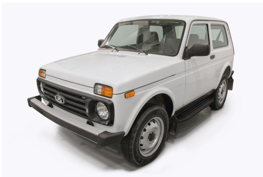
Общий вид автомобиля с порогом

Перед установкой изделия необходимо убедиться, что автомобиль, на который планируется установка, соответствует модельному ряду, указанному в настоящей инструкции. В случае затруднений с определением соответствия обращайтесь службу технической поддержки supp@rivalauto.com . В случае наезда на препятствие необходимо убедиться в отсутствии повреждений и агрегатов автомобиля и пригодности дальнейшей эксплуатации порогов. При правильной установке пороги не должны касаться узлов и агрегатов автомобиля. Производитель вправе вносить изменения в конструкцию порогов.